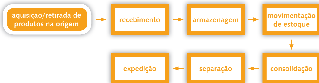
Figura 2 – Etapas do Fluxo de Distribuição

O fluxo de distribuição deve conter tudo o que for aplicável às atividades da empresa. Na Figura 2, ilustramos um exemplo das etapas desse fluxo: